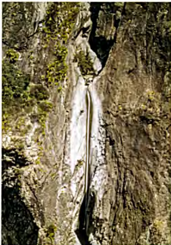
Descenso de barrancos

Agradecer a todas estas personas que son las que hacen posible con su aportación que se puedan realizar más senderos, más zonas de escalada protegidas, más refugios, realizar estudios con parques Naturales y zonas protegidas para poder seguir disfrutándolos subiendo a cumbres, tener Federación Española y también una Autonómica, en la cual, se pueden realizar planes de formación de tecnificación, competiciones, marchas, campamentos, expediciones etc..