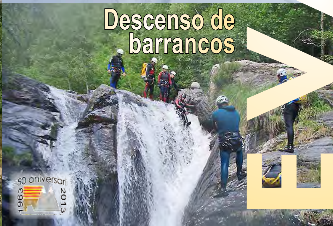
Descenso de barrancos

FEDERACIÓ D'ESPORTS DE MUNTANYA I ESCALADA DE LA COMUNITAT VALENCIANA www.femecv.com