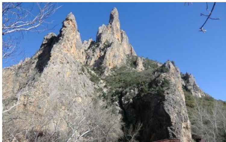
Alto de Contreras y Torreón de la Moneda en la vertiente valenciana.