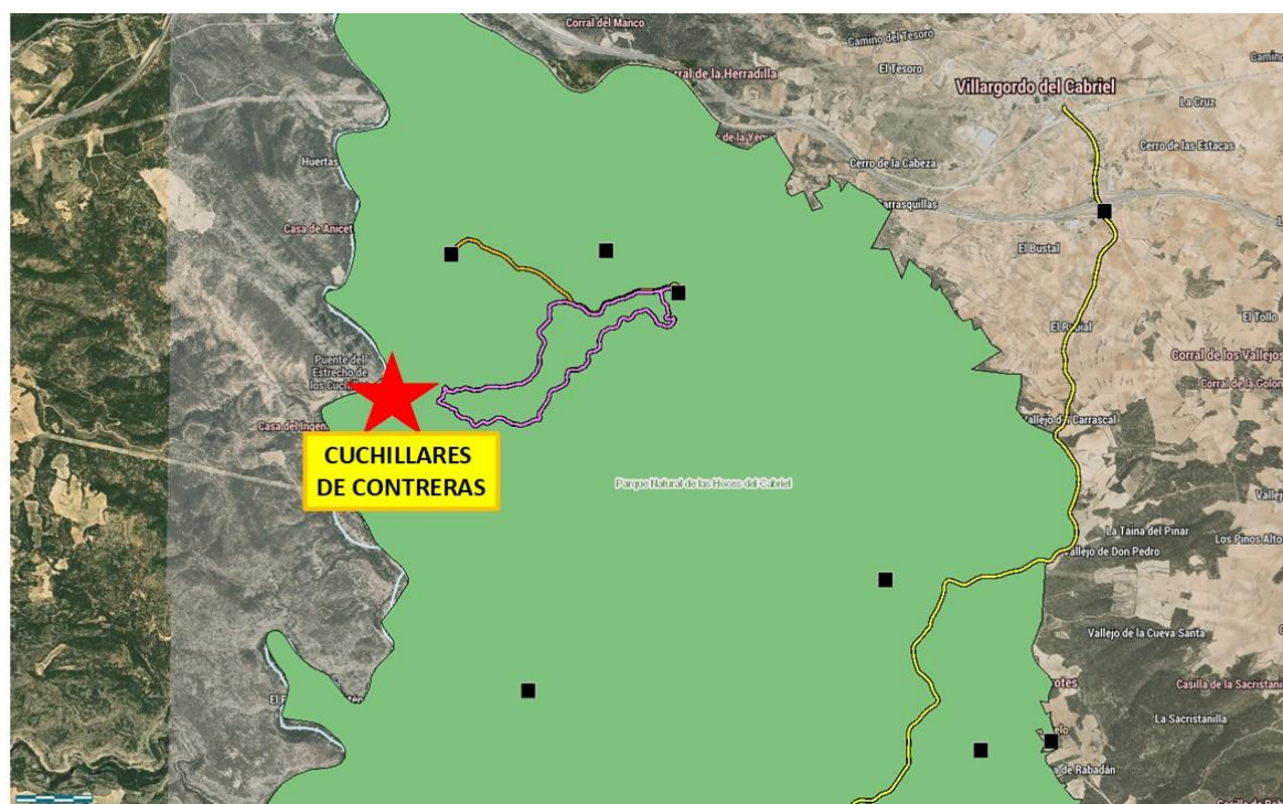
Ubicación de los Cuchillares de Contreras dentro del Parque Natural de las Hoces del Cabriel.