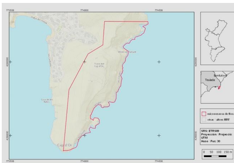
Microrreserva Cap d'Or.

Localización del Sector de escalada "Xulla" dentro de la Microrreserva Cap d'Or y de la ZEPA Penyasegats de la Marina.