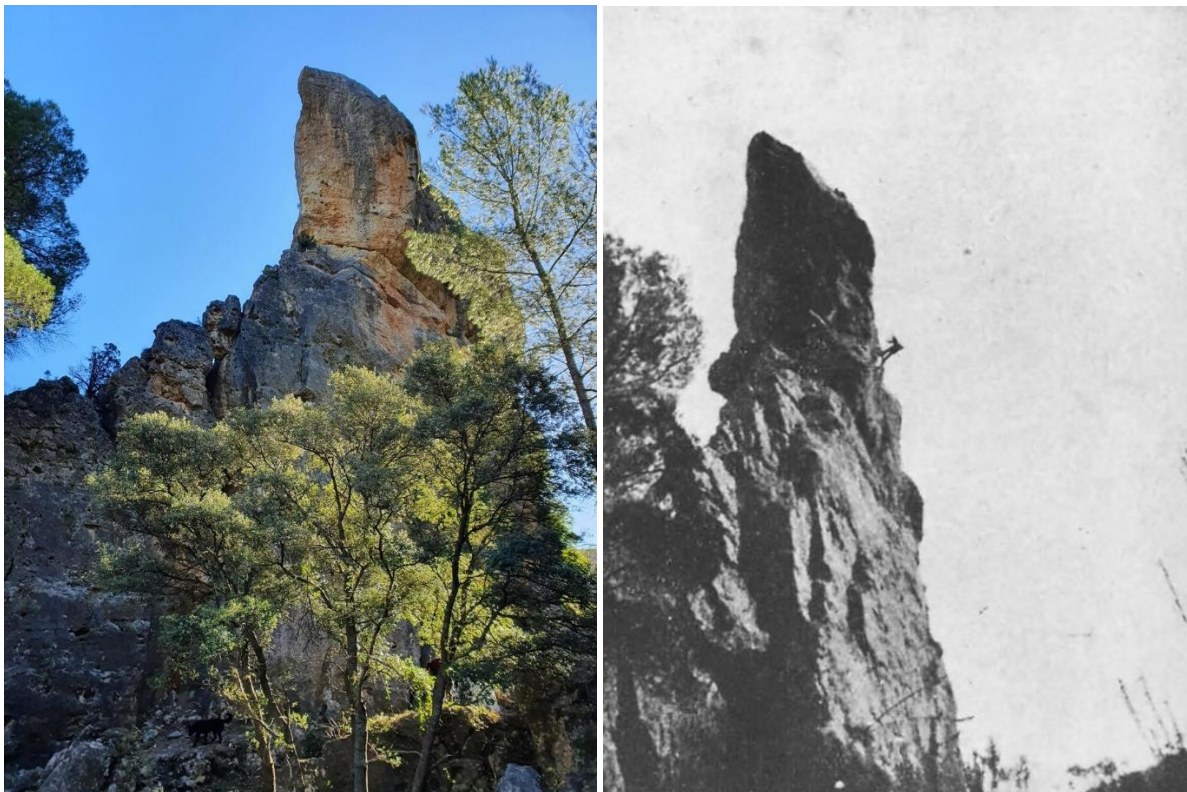
Cara oeste del Risco del Fraile (foto izquierda) y detalle del rápel para descender del Risco.