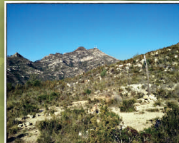
Mondúber des del Plá de la Vella