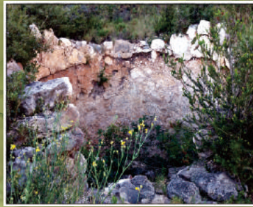
Forn de calç a les Senilleres