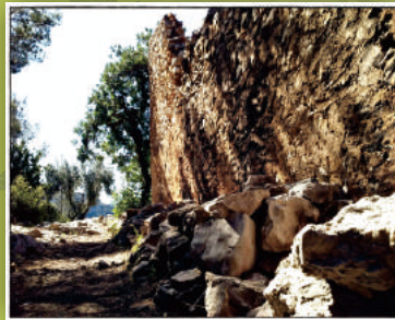
Corral de Milhores