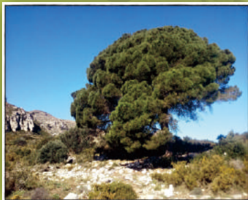
Pí al Corral de l'Obreret