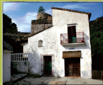
Molí de Xeresa