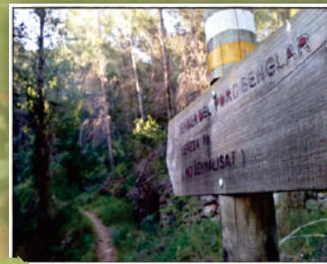
Sender del Porc Senglar