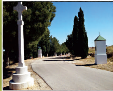
Calvari de Xeresa

En el nostre cas seguirem per la pista forestal fins el corral de l'Obreret, punt més alt de la ruta, on l'ombra d'un gran pi pinyoner ens permetrà agafar forces per seguir caminant.