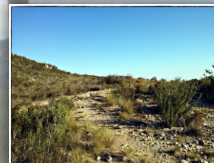
Pla de la Vella