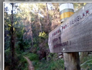
Sender del Porc Senglar