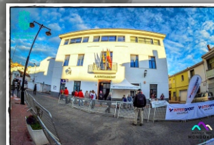
Ajuntament de Xeresa