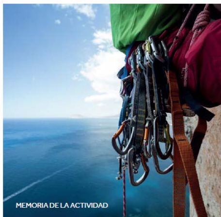
MEMORIA DE LA ACTIVIDAD